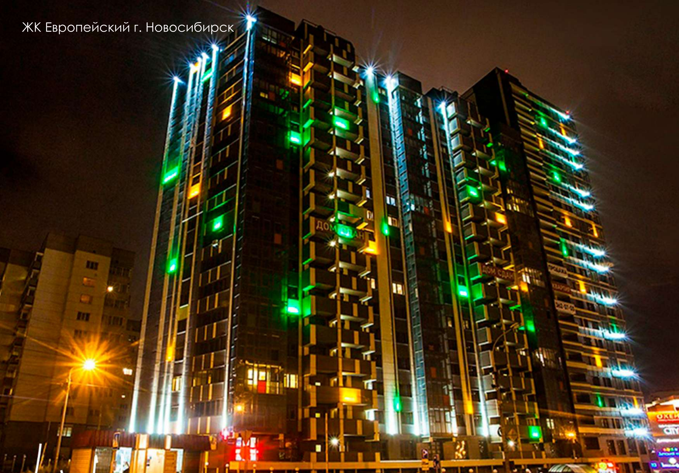
ЖК Европейский г. Новосибирск